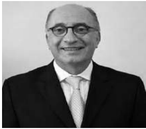
Arnaldo Nardone Uruguay Presidente del Congreso COCAL